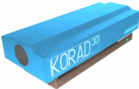
Sensorkopf KORAD 3D zur schnellen, flächenhaften und hochpräzisen Vermessung von Bauteilen mit Durchmessern von bis zu 80 mm.

Ein solches Messsystem mit modularem Aufbau hat die 3D-Shape GmbH mit Ihrer Produktlinie KORAD 3D entwickelt. Das System besteht aus einem stabilen Portal, dem Sensorkopf, der Messsoftware sowie verschiedenen Automatisierungseinheiten wie X/Y-Versteller, Rotationstisch und Bauteilzuführung. Alle Bestandteile werden an die Kundenanforderungen angepasst. So kann der Gerätestand sowohl als Einzelmessplatz im Labor, als auch als vollständig integrierte Messmaschine am Band aufgebaut werden – auch eine jeweilige Umrüstung ist möglich.