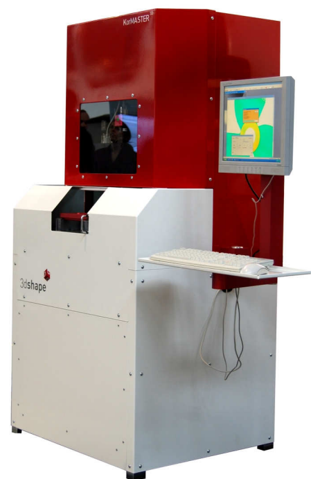
Modularer Gerätestand KorMASTER 3D . Einsetzbar in der Produktion und im Labor

Gefragt sind deshalb Systeme, die eine möglichst große Bandbreite von Applikationen abdecken, d.h. an verschiedene Bauteile und Messaufgaben anpassbar sind. Vor allem kleine und mittelständische Unternehmen können es sich kaum leisten, für jeden neuen Produktionsauftrag eigene Messsysteme anzuschaffen, deren Kaufpreis nicht selten bis zu 200.000 Euro oder mehr betragen kann. An Universalgeräten gibt es derzeit zwar keinen Mangel, jedoch sind solche Messgeräte selten eine akzeptable Lösung, da entweder nur ein geringer Teil der implementierten Funktionen abgerufen wird – was das Gerät unnötig teuer macht –, oder die Systeme durch ihre universelle Ausrichtung Einbußen an Genauigkeit, Schnelligkeit und damit Effektivität erleiden. Eine viel bessere Lösung stellt eine durchdachte Plattform-Technik dar, die durch modulare Ausbaukonzepte den variierenden Anforderungen der Hersteller ohne Qualitätsverluste nachkommen kann.